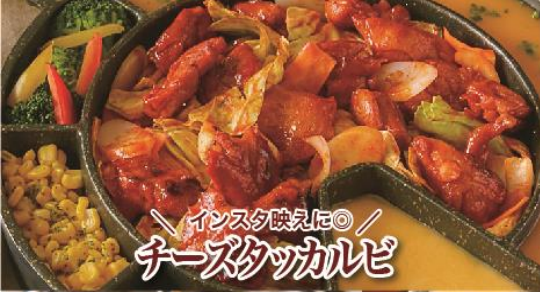
インスタ映えに◎ チーズスタッカルビ