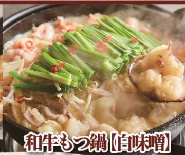
和牛もつ鍋【白味噌】