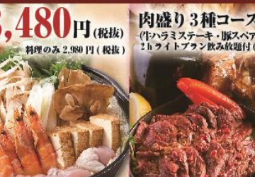
肉盛り3種コース (牛ハラミステーキ・豚スベアリの焼ねぎまじり) 2hライトプラン飲み放題付(7品) 料理のみ 2,980円(税抜)