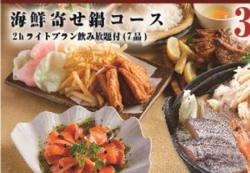
海鮮寄せ鍋コース 2hライトプラン飲み放題付(7品) 料理のみ 2,980円(税抜)