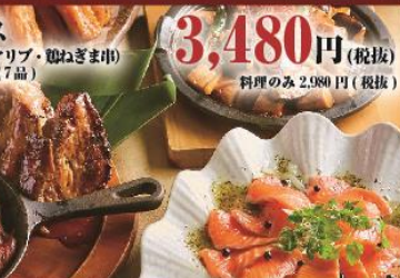
3,480円(税抜) 料理のみ 2,980円(税抜)