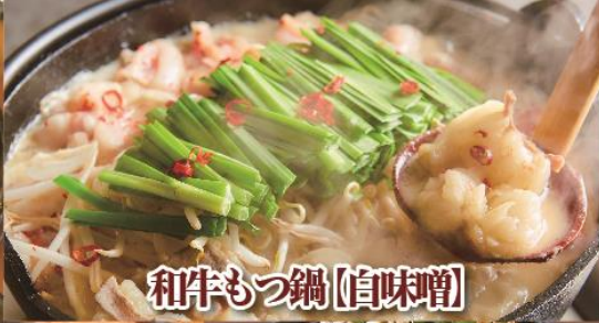
和牛もつ鍋【白味噌】