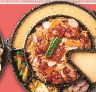
チーズスタッカルビ