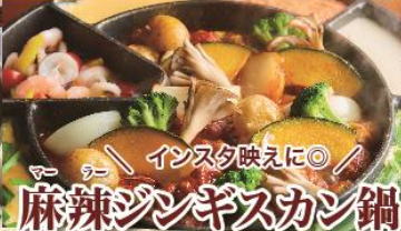
インスタ映えに◎ 麻辣ジンギスカン鍋